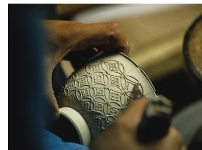
「洸春窯」“いっちゃん”作業イメージ