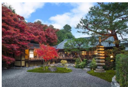
レストラン「京 翠嵐」

「翠嵐ラグジュアリーコレクションホテル 京都」は2015年3月に国内初の「ラグジュアリーコレクション（The Luxury Collection®）」ブランドを冠するホテルとして京都・嵐山に誕生しました。四季折々の美しい情景や伝統とモダンが溶け合う空間、そして京都らしさを込めたおもてなしに、あたたかいお褒めの言葉を頂戴しております。